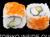
TOBIKO INSIDE OUT