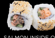
SALMON INSIDE OUT