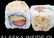
ALASKA INSIDE OUT